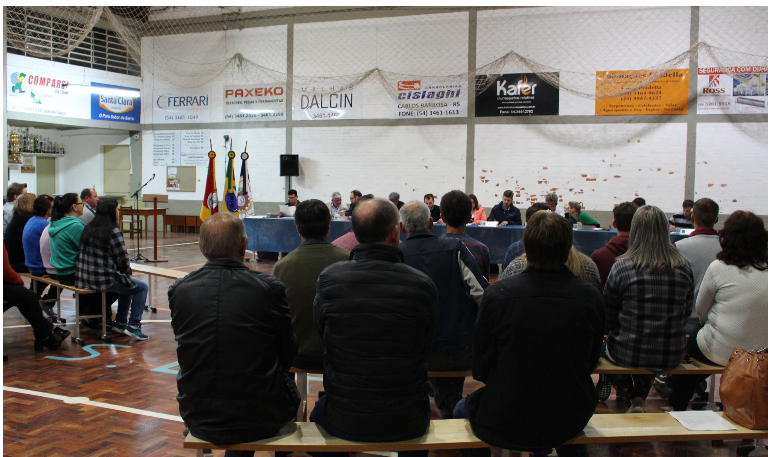
Programa Comunidade Participativa realizado na comunidade da Linha Vitória em 2018.

Regulamentado pela Resolução nº 07/2009, o Programa prevê que um líder possa se manifestar, para tratar sobre as demandas da comunidade, sugerir melhorias e comentar sobre as obras realizadas. Todos participantes podem realizar sugestões, conforme as necessidades da comunidade, que posteriormente serão encaminhadas ao Chefe do Poder Executivo e analisadas, quanto a sua viabilidade.