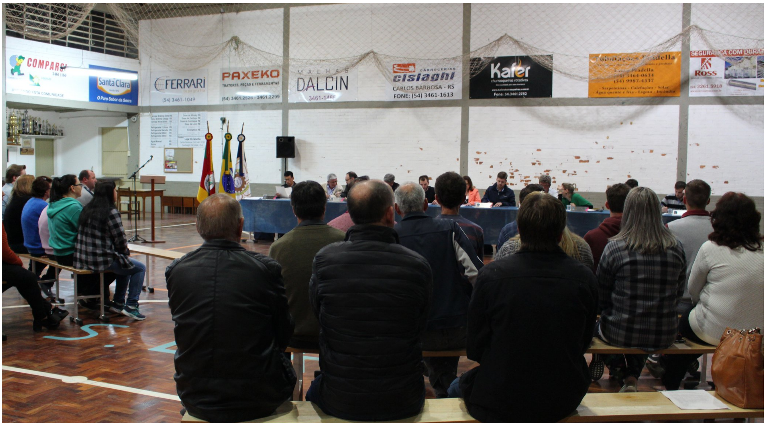
Programa Comunidade Participativa realizado na comunidade da Linha Vitória em 2018.

Regulamentado pela Resolução nº 07/2009, o Programa prevê que um líder possa se manifestar, para tratar sobre as demandas da comunidade, sugerir melhorias e comentar sobre as obras realizadas. Todos participantes podem realizar sugestões, conforme as necessidades da comunidade, que posteriormente serão encaminhadas ao Chefe do Poder Executivo e analisadas, quanto a sua viabilidade.